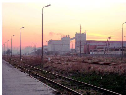
Photo.1 The view of Kokoszki district

The main heat supplier for the Kokoszki district is a local utility company Przedsiębiorstwo Usług Energetycznych i Komunalnych UNIKOM Ltd. The heat source is the heating plant with high-temperature boilers, which are fired with coal. The parameters of the heating network are 125/75 C o. Some of the companies in the Kokoszki Business Park use LPG and electricity. Electricity is also used for production processes, ventilation and air-conditioning, interior lighting and street lighting. The demand for energy of particular entities is varied due to their diversified scope of activity and the condition of their buildings. A small number of buildings are new ones, constructed with the use of new technologies, thus not requiring substantial thermal retrofitting. Some other building erected several dozen years ago need extensive retrofitting. Within the GoEco programme, energy audits and thermovision surveys, as well as feasibility studies for particular technologies are being performed for selected buildings of the park. Possible financing solutions for implementation of measures recommended in the energy audits are under study.