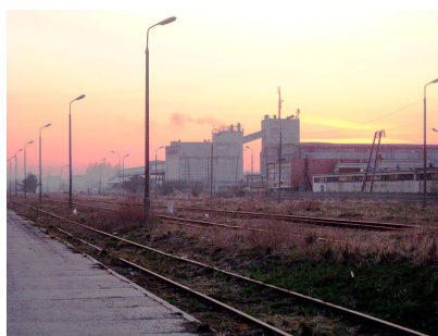
Foto.1 Widok na Kokoszki

Część przedsiębiorców korzysta również z gazu płynnego oraz energii elektrycznej. Energia elektryczna jest wykorzystywana również do celów produkcyjnych i klimatyzacyjno-wentylacyjnych, jak też oświetlenia wewnętrznego oraz oświetlenia ulic. Wielkość zapotrzebowania na energię poszczególnych podmiotów jest bardzo zróżnicowana z uwagi na dużą różnorodność prowadzonej działalności jak też stan budynków. Niewielką część budynków stanowią budynki nowe, zbudowane w nowoczesnych technologiach, nie wymagające modernizacji. Inne sprzed kilkudziesięciu lat wymagają gruntownej termomodernizacji. Dla wybranych obiektów wykonywane są w ramach programu GoECO audyty energetyczne oraz badania termowizyjne, a także studia wykonalności określonych technologii. Analizowane są możliwości pozyskania środków na wdrożenia zaleceń wynikających z audytów.